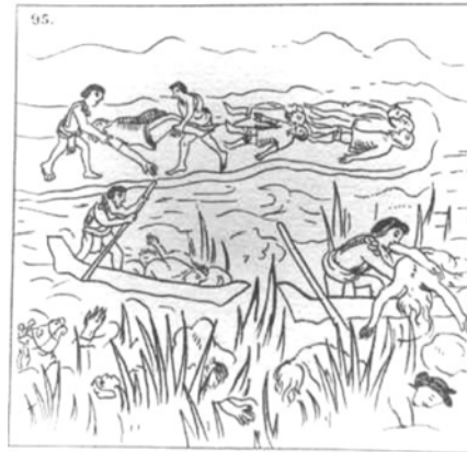
Códice florentino. Libro XII.

sólo cuerpos de varones y caballos, sino también la presencia de mujeres que han muerto como resultado de la batalla.