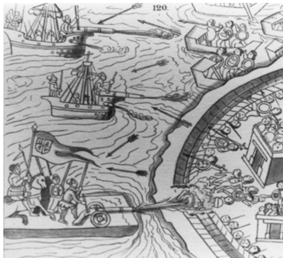
Códice florentino. Libro XII.

“Cuauhtémoc determinó de no mostrar su flaqueza ni cobardía, antes queriendo dar a entender que no le faltaba gente y fuerza para se defender; hizo vestir a todas las mugeres de la ciudad con sus armas y rodelas y espadas en las manos y que luego de mañana se subiesen en las azoteas de todas las casas...” (Durán, 1880: 60)