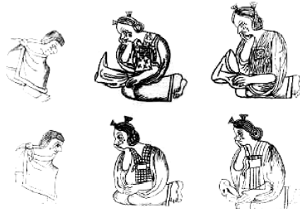
Códice Florentino , libro XI.

Por otro lado tendríamos que pensar también que en la zona maya, en la que los conquistadores no fueron recibidos como dioses, una de las estrategias de defensa era la quema y el abandono de los pueblos y los sembradíos adyacentes, ya que de esta forma se dejaba a los enemigos abandonados a su suerte y a su capacidad de encontrar por sí mismos los sustentos. Tanto Hernán Cortés como Bernal Díaz dan cuenta de esta estrategia, que se convierte en una constante en el fallido viaje de conquista a las Hibueras: