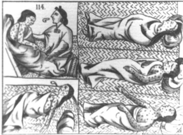
Códice florentino. Libro XII.